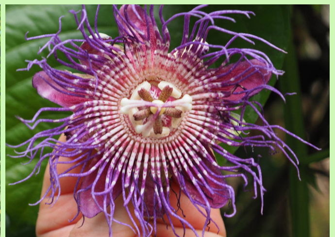
Fast noch spektakulärer als die Früchte sind die Blüten.