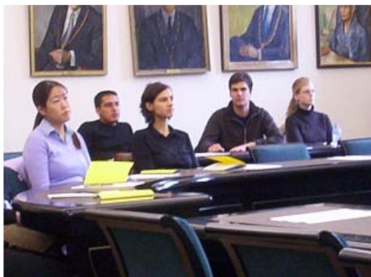
Studierende des neuen Studienganges