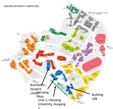
HANYANG UNIVERSITY CAMPUS MAP