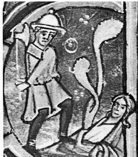
Abbildung: Kain und Abel, französisches Gebetbuch, 16. Jh.

Sah die christliche Kunst in Kain den Prototypen Synagogas vorgeprägt, hatte sich dieser samt Judenhut und / oder auffälliger Hakennase in das betont reizlose Klischee einzufügen, wohingegen Abel bisweilen gar mit Bischofsmitra für die Kirche stand. 17 Somit war dem christlichen Betrachter der Konnex zwischen der unrühmlichen Tötung Abels und Jesu Kreuzestod aufgenötigt worden.