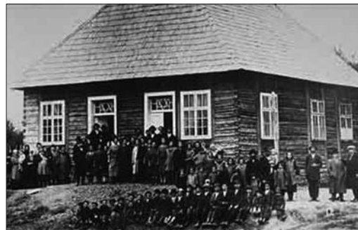
Sighet: Jüdische Gemeinde vor der Synagoge, 1930 – 1939

Seine Eltern unterhalten ein kleines Lebensmittelgeschäft – bis zu dem Tag der Deportation nach Auschwitz in Frühjahr 1944, wo er seine Mutter und seine kleine Schwester für immer verliert. Seine zwei älteren Schwestern und er selbst überleben wie durch ein Wunder. Der Vater stirbt in den letzten Kriegsmonaten im Lager Buchen-