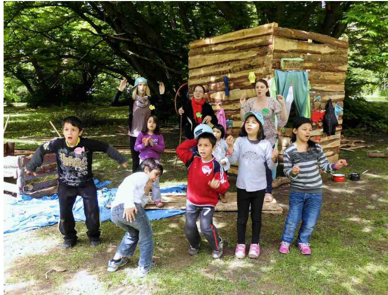
Abbildung 2: Gruppe der Fischer, Szenenerarbeitung vor selbstgebaute Hütte, Tag 6

der Qualität und Quantität angeboten wurde. Bis die Kinder die Strukturen frei anwenden können, bedarf es zunächst eines rezeptiven Angebotes, einer metasprachlichen Reflexion sowie Strukturentlockungen (Elizitierungen) im kontrollierten Rahmen. Der weitere Weg hin zur freien Anwendung sollte binnendifferenzierend flankiert sein von sprachlichen Stützen (z.B. in Form ausgelegter Karteikarten), auf die die Kinder je nach Sprachsicherheit mehr oder weniger zugreifen.