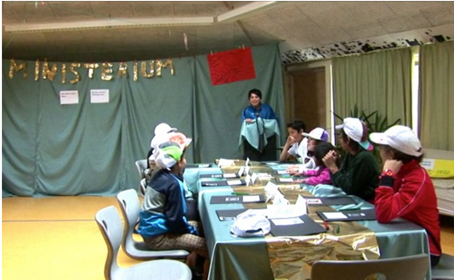
Abbildung 3: Präsentationsphase – Die Minister stellen sich vor