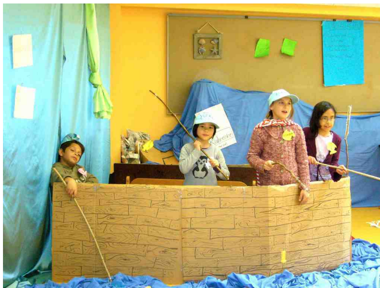
Abbildung 1: Gruppe der Fischer, Szenenerarbeitung mit selbstgebauten Requisiten, Tag 3

zentralen Merkmale des Tübinger Theatercamps. Ein (im Vergleich zu anderenorts stattfindenden Theaterprojekten) weiteres Herausstellungsmerkmal ist der sich am Sprachentwicklungsstand orientierende systematische Aufbau/Ausbau bildungssprachlicher Fähigkeiten in sprachlich relativ homogenen Gruppen (siehe 2.2).