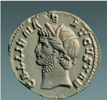
Abb. 1 Gipsabguss eines Aureus des Gallienus, 265 n. Chr., Universität Tübingen

Warum spricht uns ein Kunstwerk, ein Artefakt an? Warum und wie affiziert es uns? Warum kommt es – gerade heute – etwa zu Besucherrekordzahlen in Museen, zu kontroversen Diskussionen über einige Gedichtzeilen an Häuserwänden? Was suchen wir, wenn wir ein Musikstück hören, uns in einem Bild verlieren? Wozu dient Kunst? Ist Kunst überhaupt Kunst, wenn sie zu etwas dient? Ja, wovon reden wir, wenn wir von Kunst reden? – Die hitzigen öffentlichen Debatten, aber auch die Forschungsdiskurse, die sich in den vergangenen Jahren um diese Fragen herum entwickelt haben, bezeugen ein neues Bedürfnis nach und Interesse an Ästhetik weit über den Gesichtskreis der Geisteswissenschaften hinaus. Von einem ‚aesthetic turn‘ war insbesondere in den Gesellschafts- und Naturwissenschaften die Rede.