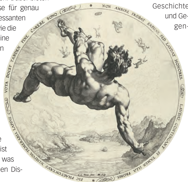
Abb. 2 Hendrick Goltzius nach Cornelis van Haarlem: Phaeton aus der vierteiligen Serie der Himmelsstürmer (3/4), Epigramm von Franco Estius, um 1588, Kupferstich, Amsterdam, Rijksmuseum