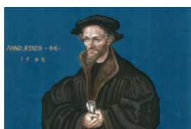
Melanchthon hat was gegen Epidemien