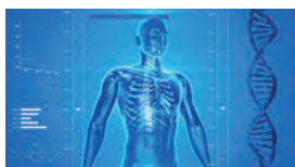
Individualisierung und Demokratisierung der Versorgung von Krebspatienten mittels KI