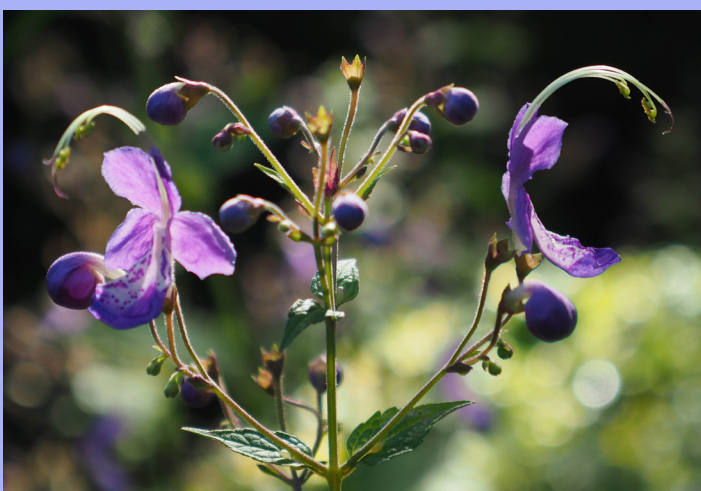
Staubblätter und Griffel ragen weit über die Blüte hinaus.

Zum anderen kann man Hummeln beim Blütenbesuch beobachten. Und dann wird die Stauden-Bartblume zur Hummelschaukel : sobald die schwergewichtigen Blütenbesucher auf der zarten Unterlippe der Blüte landen, klappt die ganze Blüte dank des dünnen Stielchens nach unten, so dass die Hummeln kopfüber hängen und der klebrige Pollen an ihrem Rücken haften bleibt. Die Blüte schwingt zurück, wenn das Insekt weiterfliegt – eine verblüffende Schaukelbewegung, die sich gut beobachten lässt.