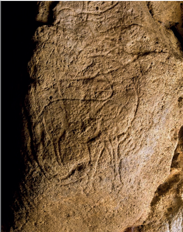
Abb. 6: Grotte de Pair-non-Pair nördlich von Bordeaux.

oben) Die Gravuren aus dem Aurignacien bedecken die Decke und Wände der kleinen Wohnhöhle, die von einem kleinen Loch links oben (hier nicht sichtbar) ein wenig erhellt wird. Das „Agnus dei“ genannte Pferd ist in der rechten oberen Ecke erkennbar, darüber ein zweites ähnliches. Das linke Panneau wird von einem großen nach rechts blickenden Hirsch dominiert. Im Hintergrund endet die Höhle jenseits des hier nicht sichtbaren kleinen Wasserbeckens. Foto: © Philippe Berthé – Centre des monuments nationaux. unten) Das von Abbé Breuil wegen seiner ungewöhnlichen Kopfhaltung als „Agnus dei“ bezeichnete Pferd, das ganz offensichtlich bemalt war, denn schon Daleau bemerkte Spuren von Ocker (Foto: © Philippe Berthé – Centre des monuments nationaux. Wiedergabe mit freundlicher Genehmigung).