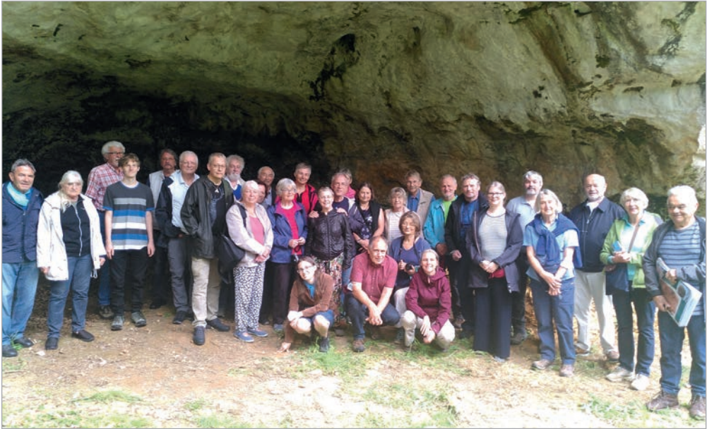
Abb. 8: Die Exkursionsgruppe der GfU vor dem Abri La Chaire-à-Calvin (Foto: Patrick Lapeyre. Wiedergabe mit freundlicher Genehmigung).