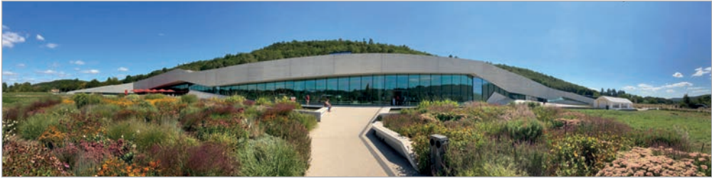
Abb. 2: Das neue Centre International de l'Art Pariétal in Montignac mit dem Nachbau der Höhle von Lascaux (Lascaux IV); dahinter der Hügel, in dem sich die originale Höhle befindet.