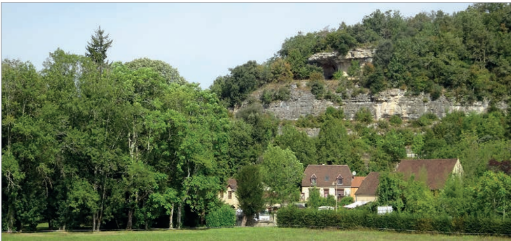
Abb. 3: Der Felsen über dem Ort Le Moustier; gut zu erkennen das obere Abri, verdeckt dagegen das berühmte untere Abri.