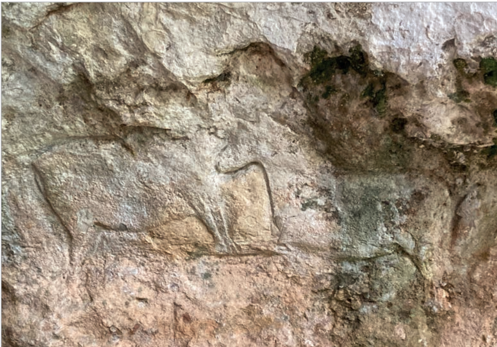
Abb. 7: Detail des Abri La Chaire-à-Calvin bei Angoulême; die beiden Tiere werden teilweise als Pferde, mittlerweile aber auch als Steinböcke interpretiert.

La Chaire-à-Calvin. Das Abri „Calvins Kanzel“ ist nach dem Reformator benannt, der einer nicht nachgewiesenen Überlieferung nach dort gepredigt haben soll. Der etwa 12 m breite Fries (Abb. 7) zeigt – so die derzeitige Interpretation – in der Mitte zwei Steinböcke und rechts und links davon je ein Pferd, von denen das rechte offensichtlich, vergleichbar mit Cap-Blanc, aus einem Bison umgearbeitet wurde (Pinçon et al. 2018). Bei der Entdeckung des Frieses im Jahre 1927 waren noch Farbspuren erkennbar. Datiert wird er ins Magdalénien. Vor diesem Abri wurde das obligatorische Gruppenfoto geschossen (Abb. 8).