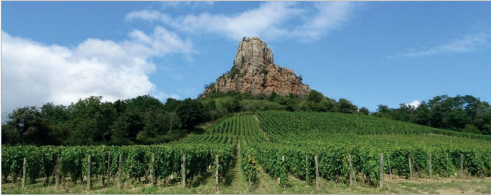
Abb. 1: Der Felsen von Solutré.