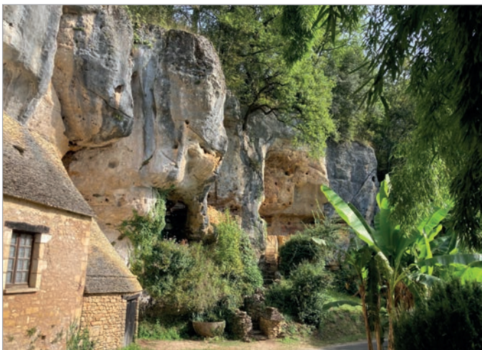
Abb. 4: Der Felsen bei Saint-Cirq-du-Bugue mit einem Teil der troglodytischen Anlage, die sich noch bis zu der Grotte du Sorcier weiter links (nicht im Bild) erstreckt.

Grotte du Sorcier (auch: Grotte de Saint-Cirq-du-Bugue). Nach kurzer Busfahrt kamen wir bei der nächsten Höhle an: Die Grotte du Sorcier ist Teil einer troglodytischen Anlage, wie die Höhlenwohnungen genannt werden, die so zahlreich im Tal der Vézère und dessen Umgebung sind (Abb. 4). Denn nicht nur während des Paläolithikums, sondern auch in der Neuzeit, vor