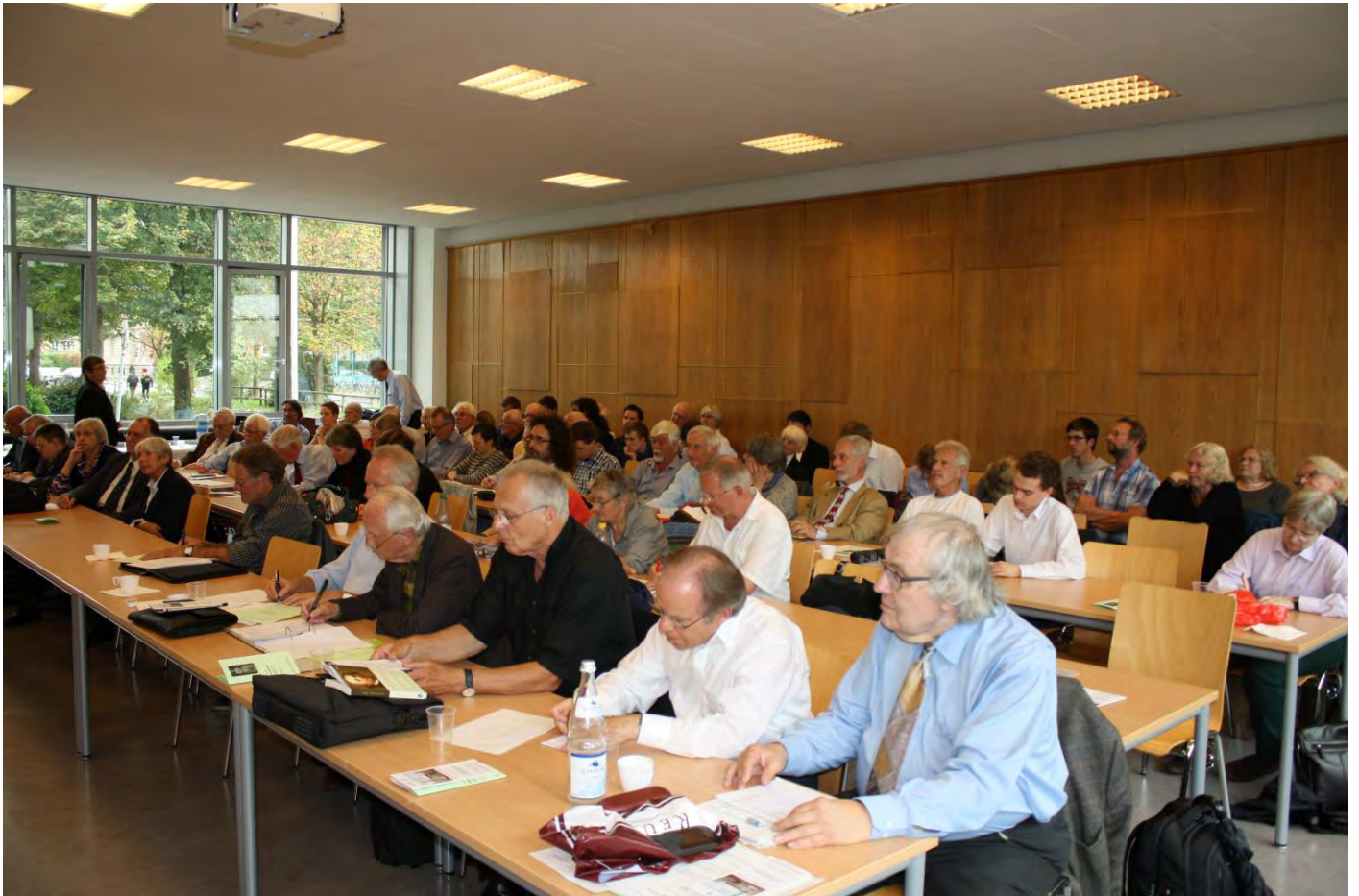
Die Tagungsteilnehmer im Großen Übungsraum der Klassischen Philologie