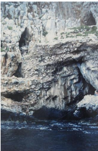
Die Höhlen von Apidima, Ansicht von der Meeresseite.