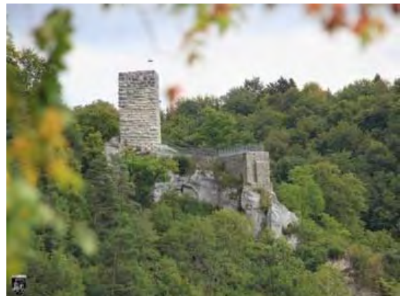
Burg Hohenhundersingen. Zu sehen ist hier der Bergfried.