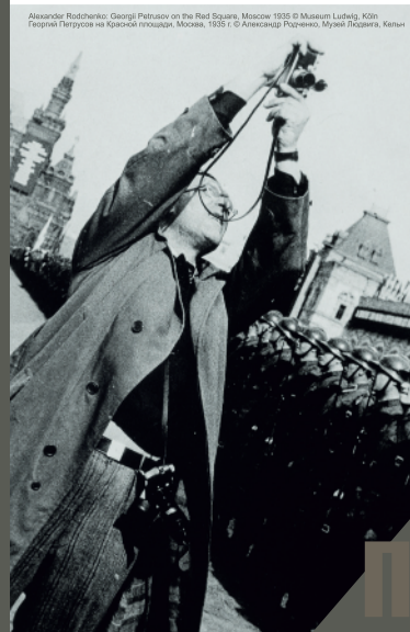
Alexander Rodchenko: Georgij Rejtanov on the Red Square, Moscow 1935. © Museum Ludwig, Köln Георгий Петрусов на Красной площади, Москва, 1935 г. © Александр Родченко, Музей Лодзкая, Катын

2-4 ОКТЯБРЯ 2013 МОСКВА, НАХИМОВСКИЙ ПР.-Т, 51/21 MOSCOW, 2 - 4 OCTOBER 2013