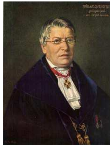
Friedrich August Quenstedt 1809 - 1889

Hörsaal Hölderlinstr. 12 Raum 320, 1.OG 72074 Tübingen