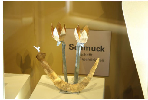
Abi Shek – o. T. Blech verzinkt und vergoldet