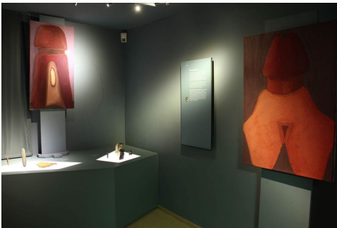
Bertram Bartl – Idole Eiöltempera auf Leinwand