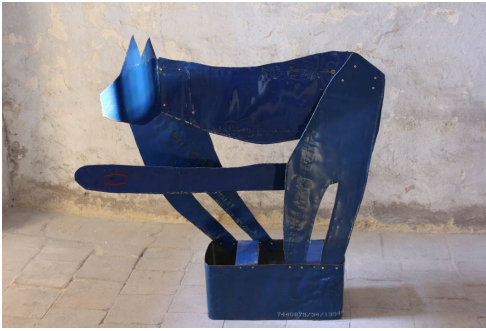
Abi Shek – o. T. blaues Ölfass