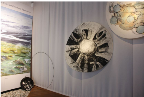
Lisa Moll – Elefanten und Tapire Tusche, Textil, Zeltstange