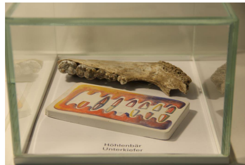
Lisa Moll – biss Gips