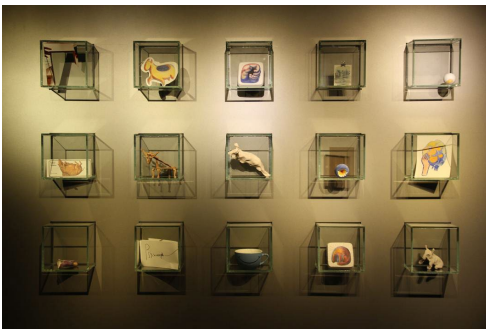
Lisa Moll – Abwesen 15 Objekte