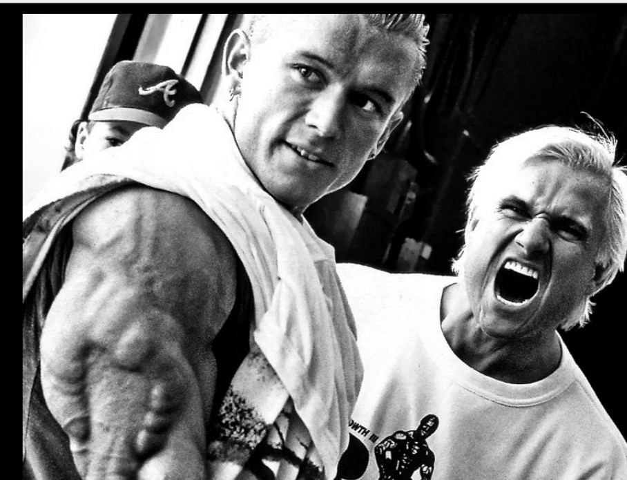
Der junge Lee Priest (l.) zeigt Tom Platz (r.) seine Trizepspose. 2