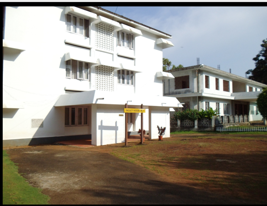
Eines der vier guest houses der Universität.