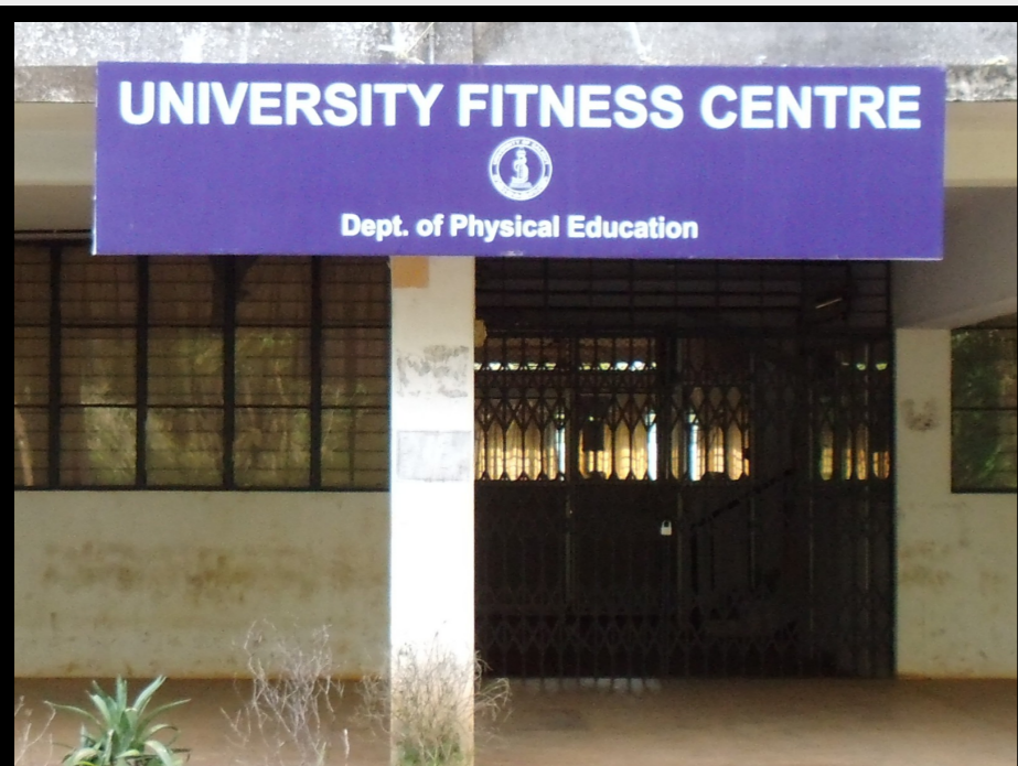
Der Eingang zum University Fitness Centre .

Die von mir und im Verlaufe meines Aufenthaltes erarbeiteten Hypothesen konnte ich gemeinsam mit den Mitgliedern des im eigens für die Studenten der Universität geschaffenen University Fitness Centre diskutieren.