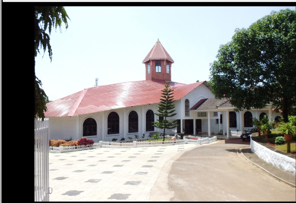
Die seminar hall der Universität.

Ich nahm an einer Vielzahl wissenschaftlicher Seminare und Diskussionen teil und erlernte, mit Hilfe meiner äußerst hilfsbereiten Kommilitonen und der Dozenten des Departments, die Malayāḷalipi (മലയാളലിപി).