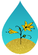
Desierto Florido e.V.