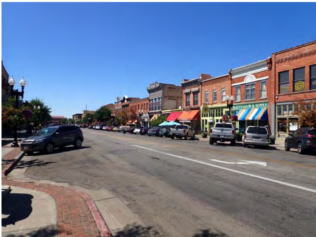
Abb. 1: 25th Street

„Yellowstone“ dient – wurde 1889 errichtet. Die 25th Street ( Abb. 1 ) im Zentrum der Stadt verläuft geradewegs auf den berühmten Bahnhof zu, der für gut 100 Jahre einer der wichtigsten Bahnknotenpunkte der westlichen USA war. Die 25th Street gehört zu den bekanntesten Straßen in den USA, denn während der Blütezeit der Stadt von den 1880er- bis Anfang der 1970er-Jahre war hier viel los: Prohibition und Alkoholschmuggel, Waffenhandel und Prostitution. Der Ruf der Stadt war derart ruiniert, dass selbst Al Capone angeblich gesagt haben soll, Ogden sei zu wild für ihn. Das ist lange her und nach einer Phase wirtschaftlicher Stagnation geht es seit Mitte der 1990er-Jahre wieder kontinuierlich bergauf. Dazu hat sicher auch die Aufwertung der Universität ihren Beitrag geleistet.