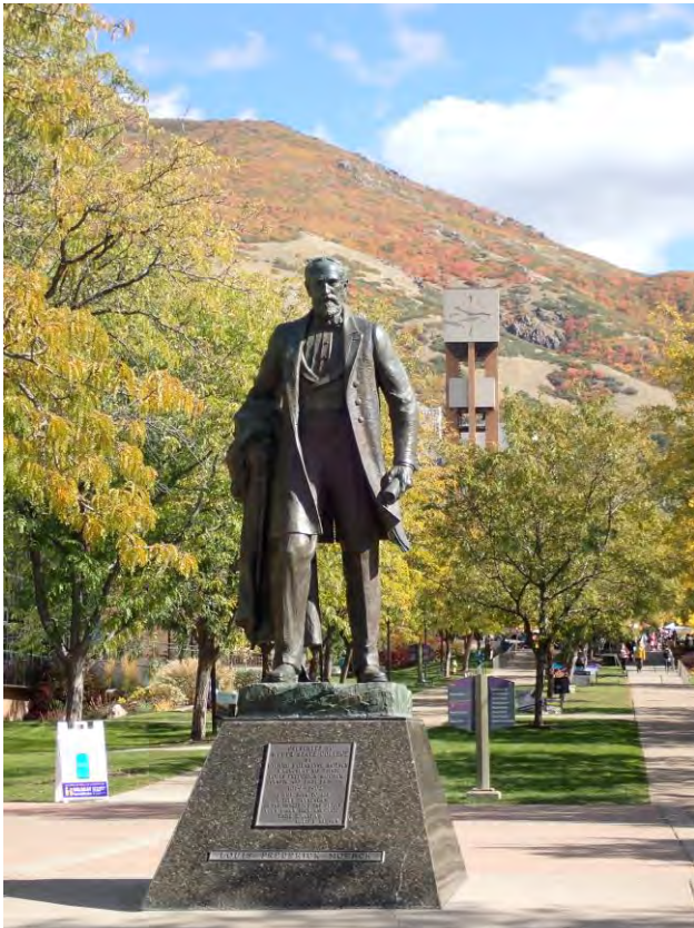
Abb. 4: Statue von L.F. Moench

Tatsächlich gibt es bereits in der Gründungszeit der Universität Bezüge zwischen Baden-Württemberg und Ogden: Der erste Rektor der damals als Weber Stake Academy bezeichneten Institution war Louis F. Moench (1847–1916), der aus Neuffen stammte. Seine Statue steht zentral auf dem Campus, direkt neben dem Lindquist Building ( Abb. 4 ).