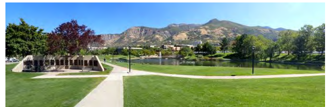
Abb. 2: Unicampus

Die Unterbringung auswärtiger Dozenten erfolgt in der ehemaligen Villa eines deutschen Professors, der vor längerer Zeit hier lehrte. Das Dozentenwohnhaus bietet Platz für bis zu acht Parteien, verfügt über zwei große Küchen, acht Schlafzimmer und großzügige Wohnräume. Als wir ankamen, beendete eine chinesische Kollegin gerade ihren einjährigen Aufenthalt, danach stand uns das gesamte Haus allein zur Verfügung.