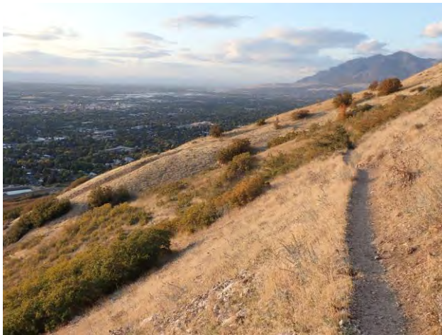
Abb. 3: Ben Lomond Trails.

Schwimmbad, Fitnesscenter, Sporthallen, Tennisplätzen und Footballstadion. Golfplätze gibt es zwar nicht auf dem Unigelände, aber in unmittelbarer Nachbarschaft. Die nahen Berge bieten zudem ein ausgedehntes Wegenetz für Wanderungen und Susan Matt zeigte uns alle wichtigen Trailheads. Die sportlichen Mühen werden durch spektakuläre Aussichten ( Abb. 3 ) auf den großen Salzsee und die beeindruckende Höhenkette entschädigt. Kanufahren, Mountainbiken, im Winter Skifahren in einem der größten und schneesichersten Skigebiete der USA, Ogden und Umgebung bieten insgesamt eine beeindruckende Vielfalt an Outdoor-Möglichkeiten.