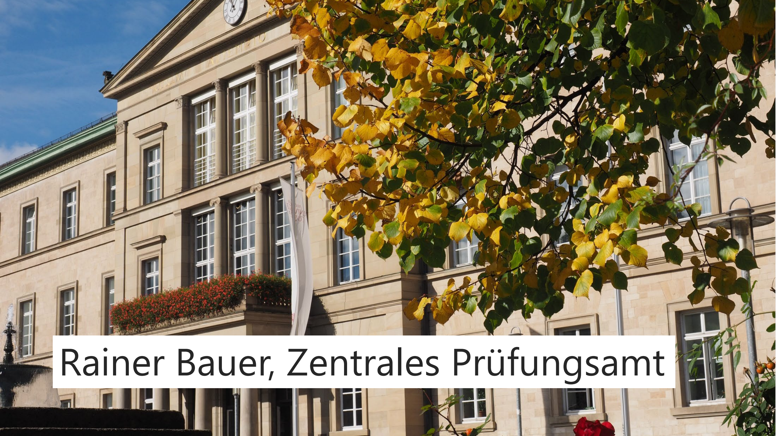
Rainer Bau, Zentrales Prüfungsamt