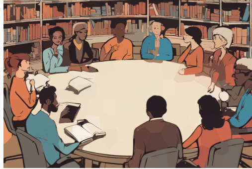
Freiheit, die wie genau gemeint ist?