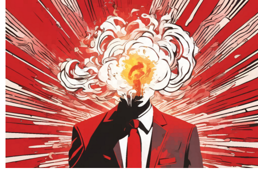
Wahnsinn als Strategie