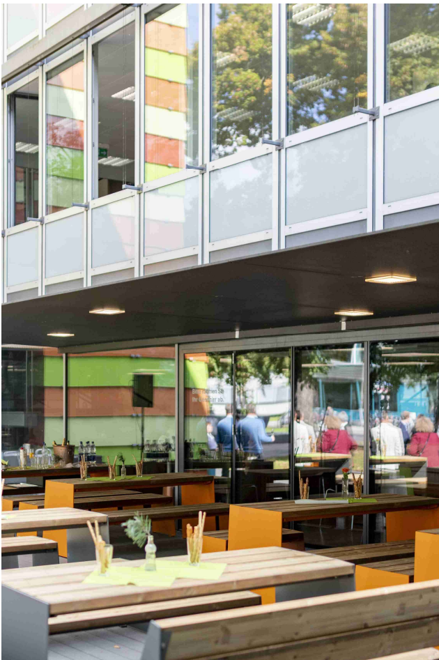
Acht Tische und 16 Bänke auf der Holzterrasse im Außenbereich vor der Cafeteria Unibibliothek vervollständigen den neuen Outdoor Learning Space.