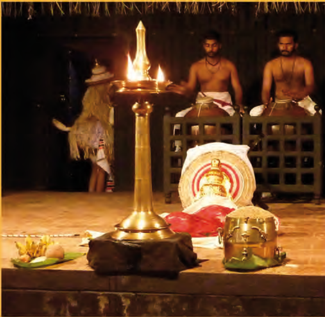
Die Bühne ist geweiht und die Musiker spielen

Wir beginnen nun – wie in Indien üblich – mit dem Entzünden einer Öllampe, Segensversen für ein gutes Gelingen der Aufführung sowie einem kurzen Tanz im Bharata-Nāṭyam-Stil zu Ehren Ganeśas, des Beseitigers aller Hindernisse und dem Alarippu, einem Eröffnungstanz, der das Aufblühen einer Lotusblüte umschreibt. Erst dann kommen wir zum eigentlichen Stück, das kurz vom bereits erwähnten Schauspielerektor, dem Sūtradhāra, und der Tänzerin eingeführt wird.