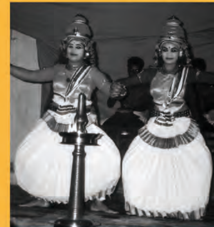
Mutter und Dienerin in einer Aufführung im südindischen Katiyattam-Stil