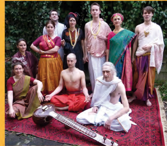
Die Aufführenden der Abteilung für Indologie und Vergleichende Religionswissenschaft des Asien-Orient-Instituts der Universität Tübingen.