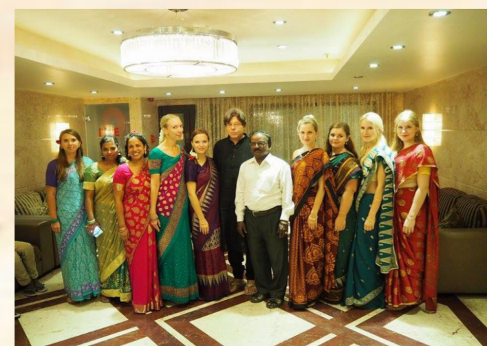
Studenten des Sprachkurses