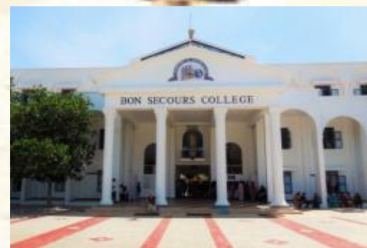
Eingang des College