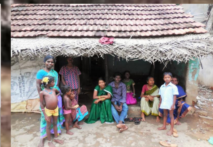
Besuch eines kleinen Dorfes